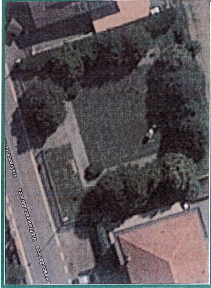
Area giochi Comunale di Via Baracca – Località Ceppine