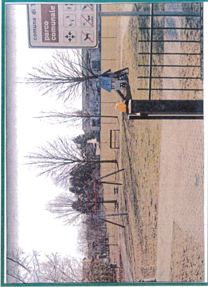
Strutture presenti: scivolo a 3 gradini + altalena con doppia seduta tipo a gabbia.