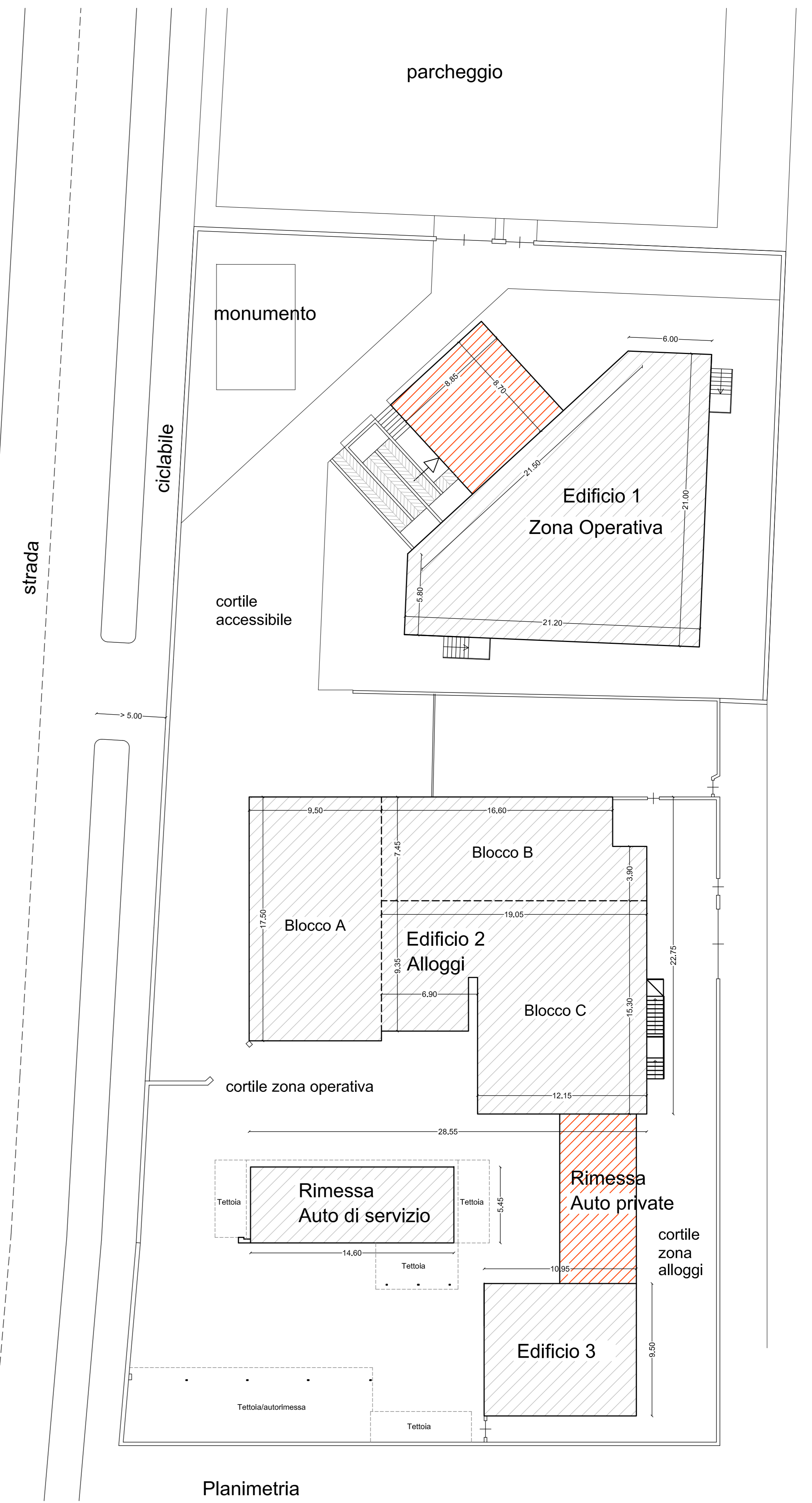
Planimetria Progetto (scala 1:200)