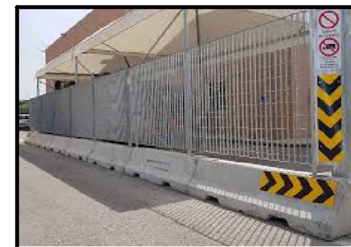
Segregazione aree di cantiere in corrispondenza di viabilità stradale