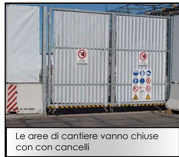
Le aree di cantiere vanno chiuse con cancelli