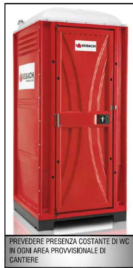
PREVEDERE PRESENZA COSTANTE DI WC IN OGNI AREA PROVVISORIALE DI CANTIERE