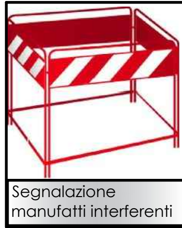
Segnalazione manufatti interferenti