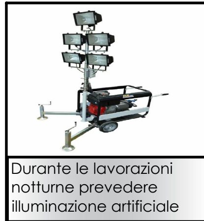
Durante le lavorazioni notturne prevedere illuminazione artificiale