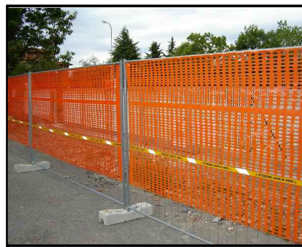
Segregare le aree di cantiere con recinzione H=2 mt colore arancio