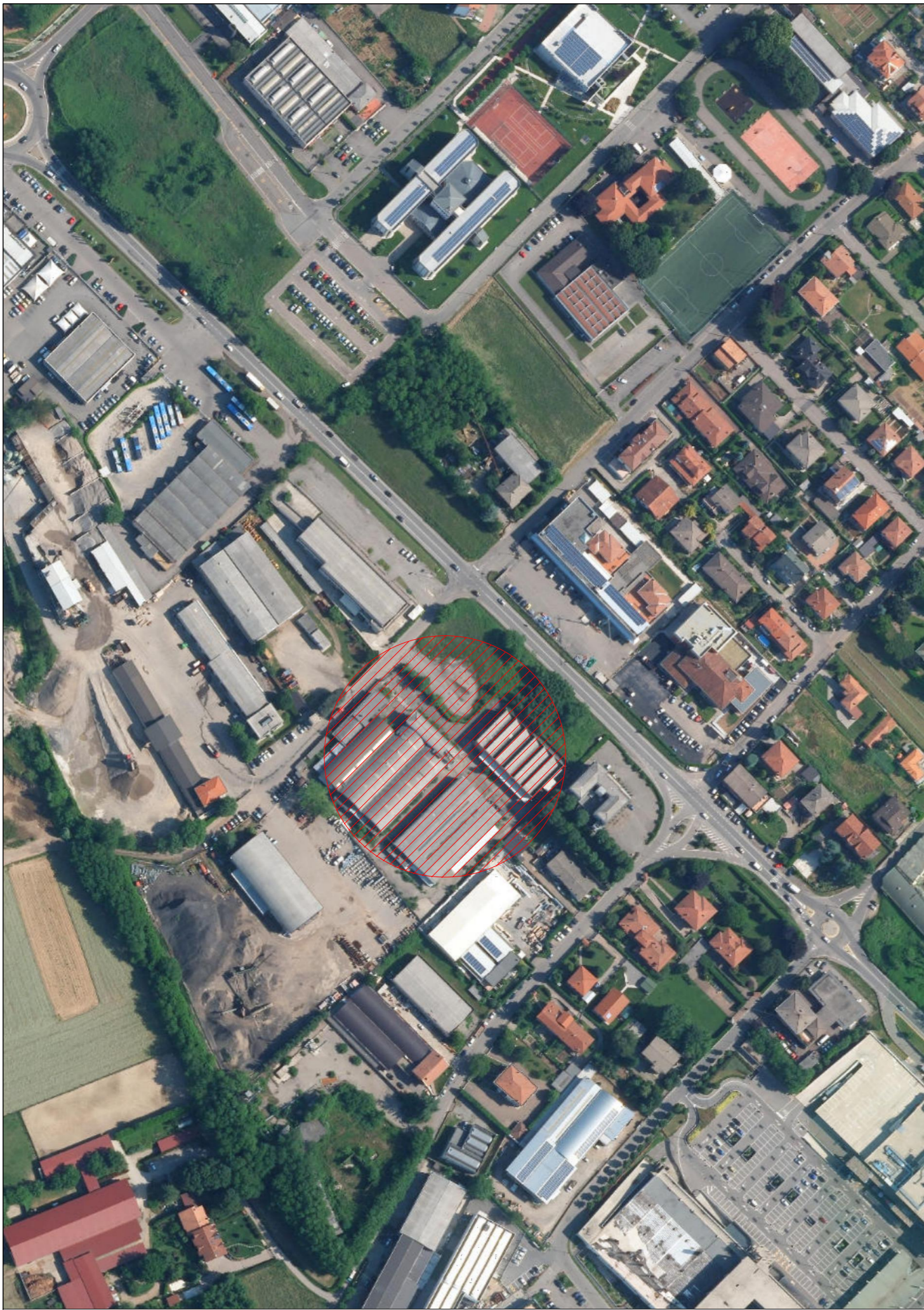
Ortofoto Scala 1: 1'000