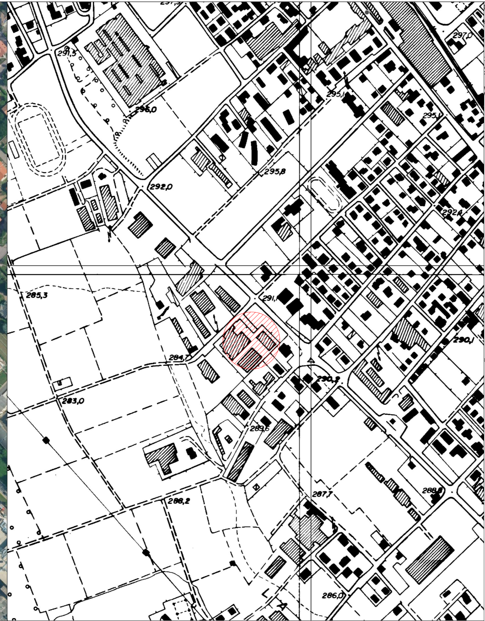
Estratto Carta Tecnica Regionale Scala 1: 2'000